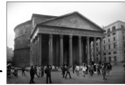
Pantheon, Rome - Photo by Ricardo André Frantz Converted to greyscale Creative Commons Attribution ShareAlike 2.5