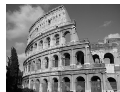
Colosseum, Rome - Photo by J. Miers

Converted to greyscale - Creative Commons by-sa 1.0