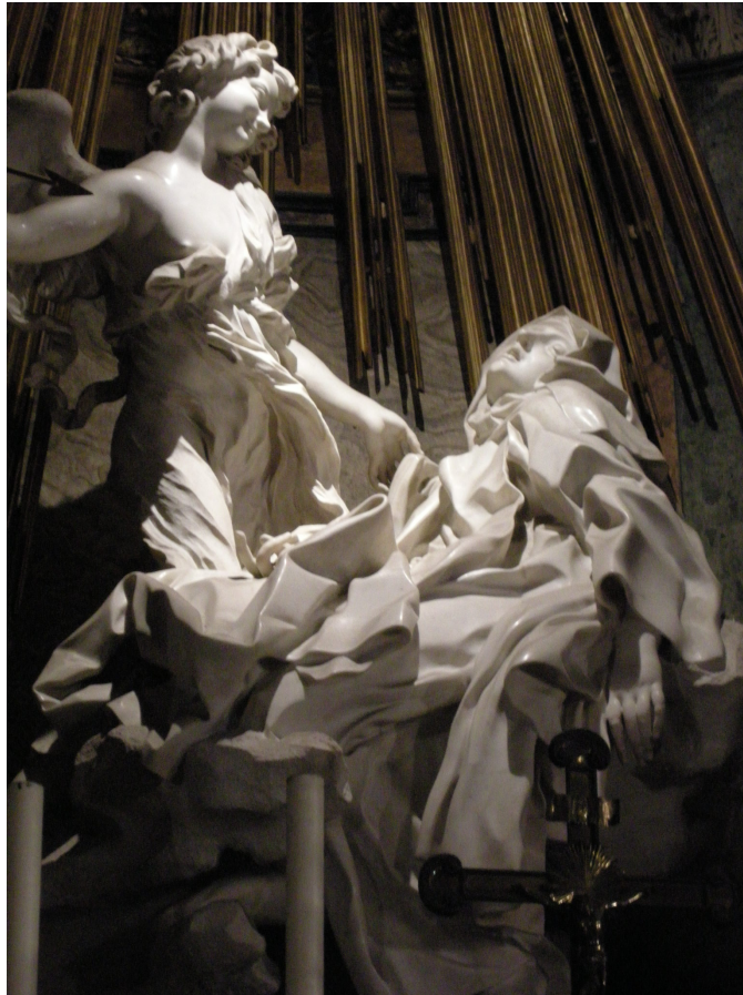
Santa Teresa di Bernini - Photo by Sailko - Creative Commons Attribution 2.5